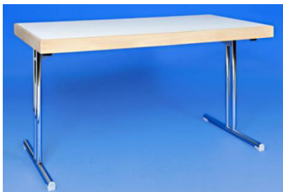
Tisch L 140 cm x B 70 cm

Verfügbares Mobiliar (Abbildungen nur beispielhaft):