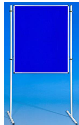
Pinwand oder Stellwand H 145 cm x B 119 cm